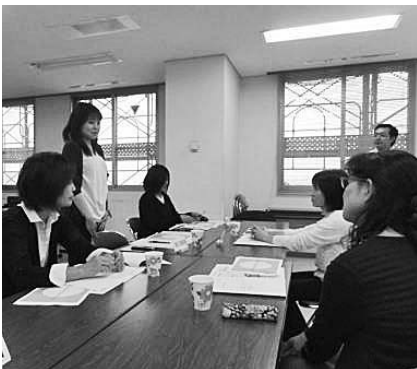
自己紹介をする研修参加者

参加者からは、「近隣の組合同士であっても総務担当者はこれまでもあまり交流する機会がなかつ