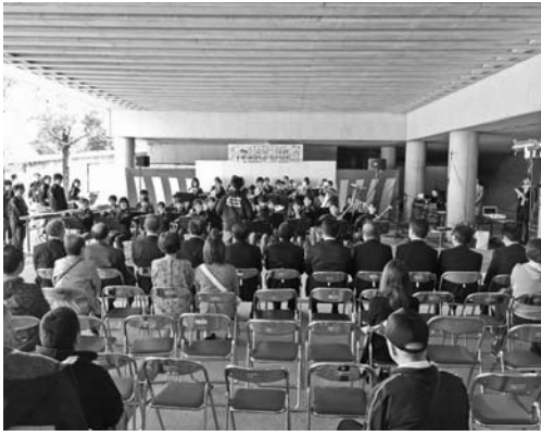
長野東高校吹奏楽部によるオープニングセレモニー

当日は、構成団体の役員・組合員・関係者及び一般の消費者をはじめ2,000人を超える大勢の方々に来場をいただき、当初の目的であった協同組合間の連携が行われ、協同組合のそれぞれの活動を県民の皆さまに広くアピールすることができました。