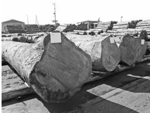
1本68万円のケヤキ(写真左)

当会の販売事業の一大イベントである開設周年記念市(国産材需要拡大特別市)のうち北信木材センターの記念市が平成30年10月25日に開催されました。