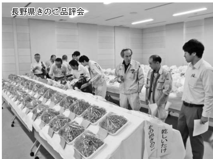
長野県きのご品評会