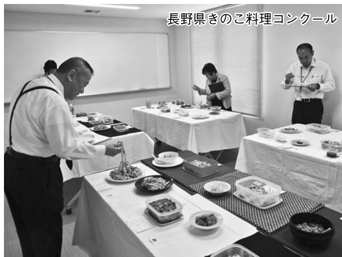
長野県きのご料理コンクール