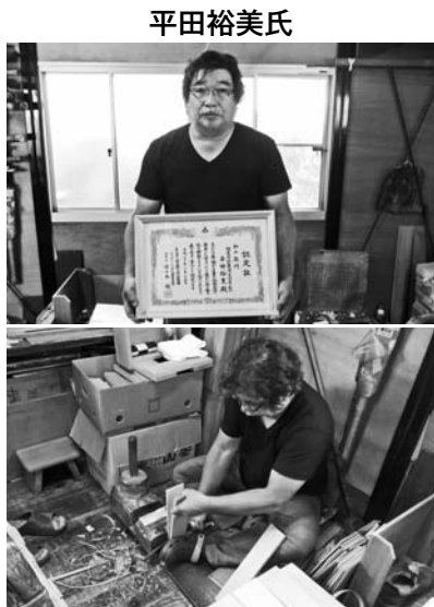
薄く真二つに割れる柿屋根板

昭和六十二年(有)ひらた製板に入社し、以来木曾産の天然サワラ材を使い、玉切られた材を、桁に割ってからナタ目を入れ、木の繊維に沿って剥いで、七厘から一分厚の屋根板を作っています。近年は一般住宅の需要は無くなりましたが、国宝金閣寺をはじめ各地の神社仏閣の屋根の修繕に製造した屋根材を納入するほか、県内を中心に県宝や重要文化財の修繕事業に職人として携わっています。